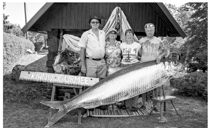
Kodukohvik KIHNU GURMEE.