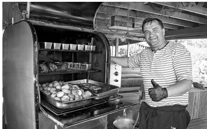
UIBU talu kodukohvik.