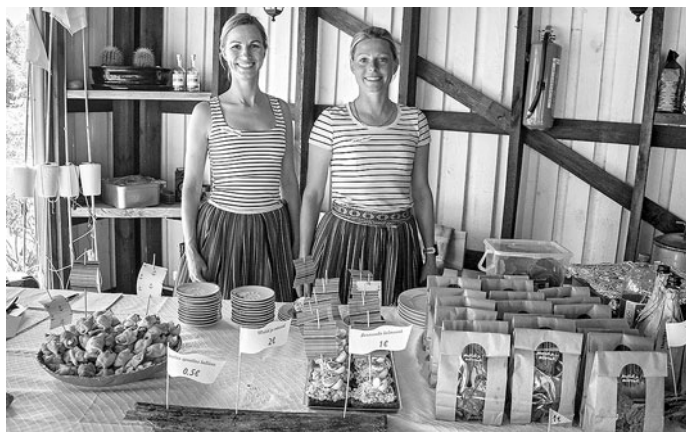
Kohvik MUTID JA MÕRRAD.