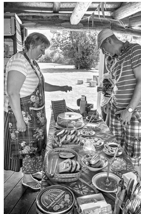
TOLLI KÖÖGI kohvik.