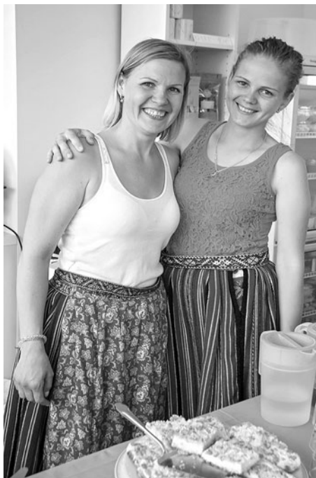
Kohvik SADAMA KÜLJE ALL.