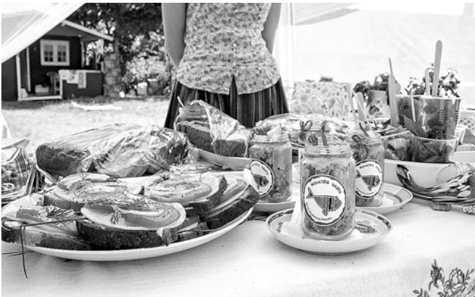
Kohvik MUIATÕS VASTA.