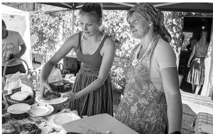
LUMISTE talu kalakohvik.