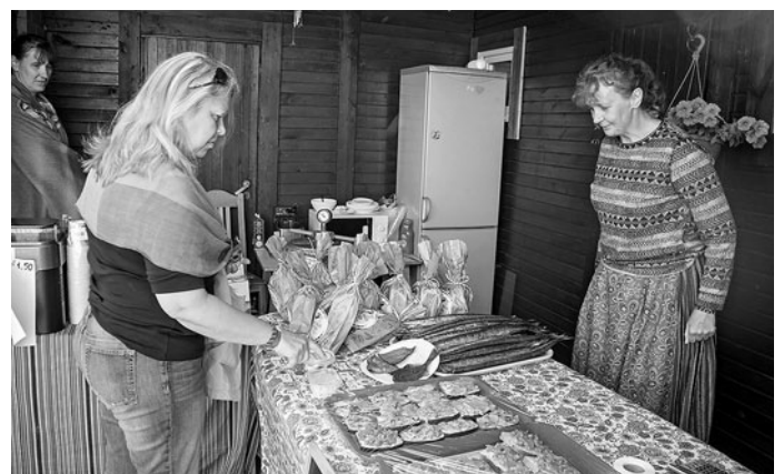
SAARDE talu kodukohvik.