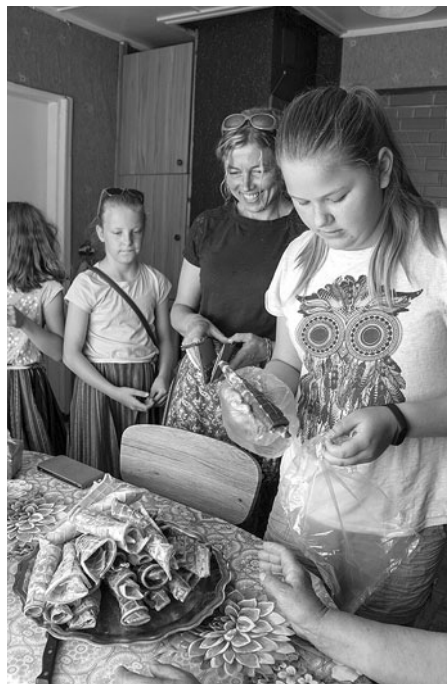
Kohvik PÄÄSUSILM Hiie talus.