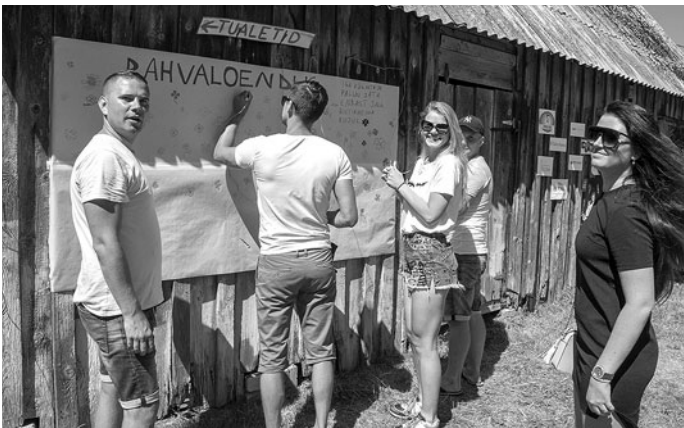
Kohvik IÄD-PARAMAD Suarõ Nuõrdõlt.